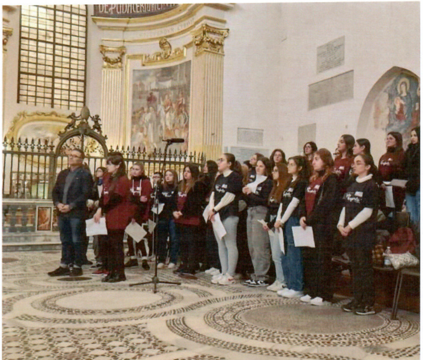
I coristi del Liceo Regina Margherita che a Natale deliziano il territorio e includono ogni età.