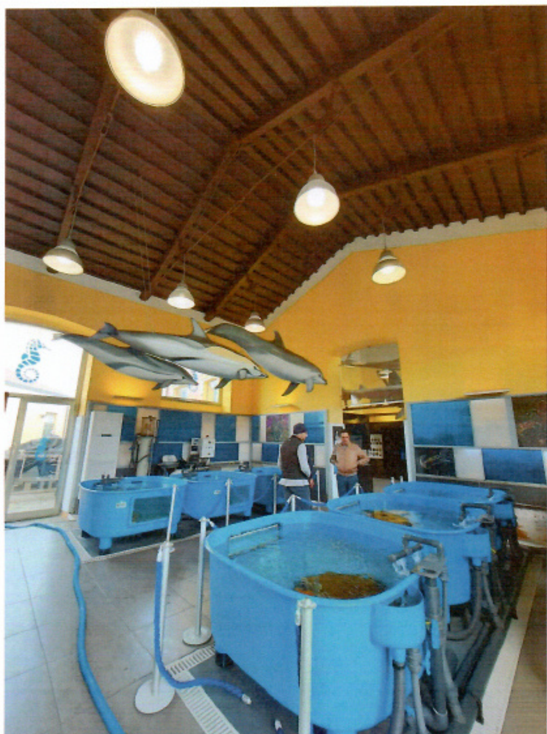
Laboratorio naturalistico: centro di ricerca e recupero di tartarughe marine