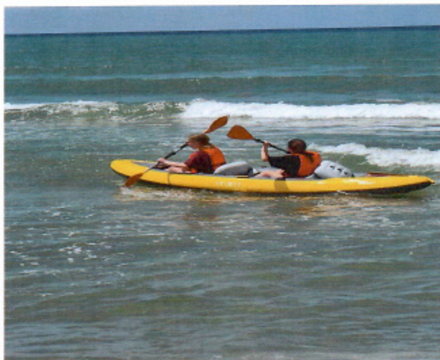
Canoa a due