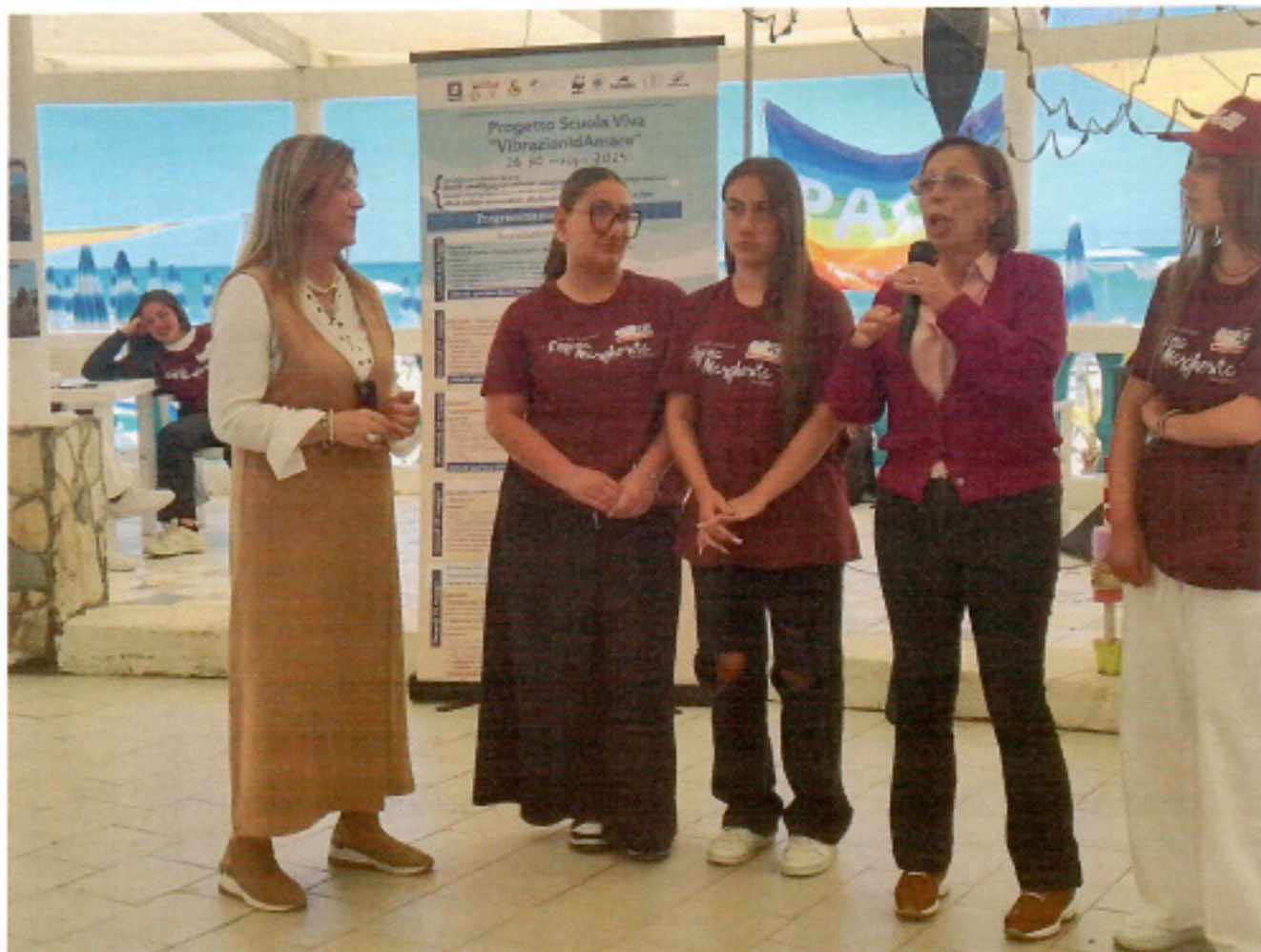
Intervento della Dirigente Scolastica e dell'assessore all'Istruzione del comune di Salerno