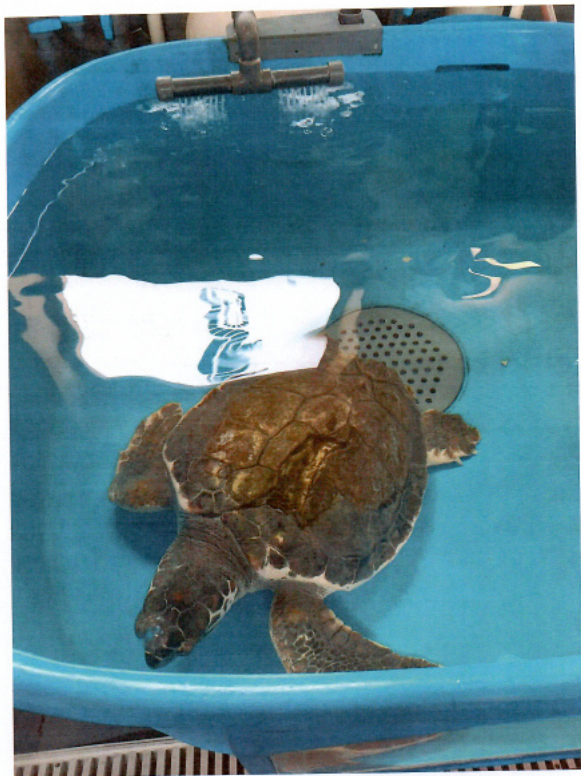
Tartaruga Caretta caretta