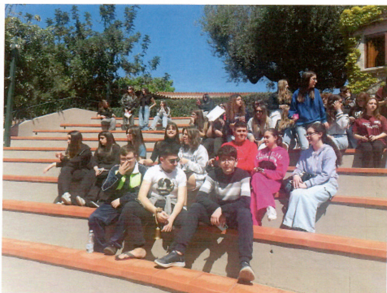
Incontro nell'arena del Happy Village di Marina di Camerota

Tutti i suddetti percorsi formativi si avvalgono delle seguenti metodologie funzionali all'inclusione e al successo formativo: