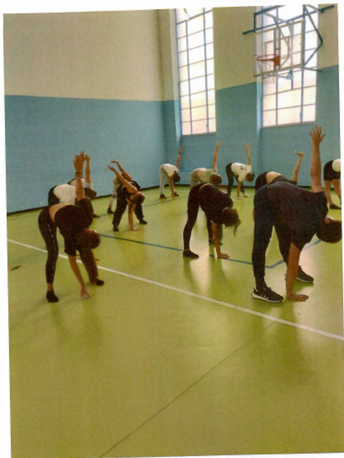
Laboratorio di danza presso la palestra del Liceo Regina Margherita